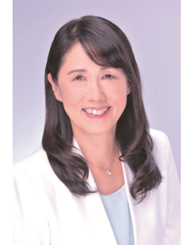
芝田市長あいさつ